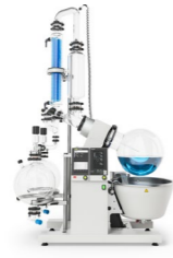
R-220 Pro / R-250 Pro